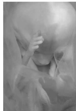
L'enfant environ 3 mois et demi après la conception.