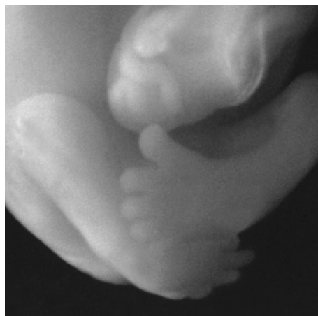
Les pieds de l'enfant environ sept semaines après la conception.