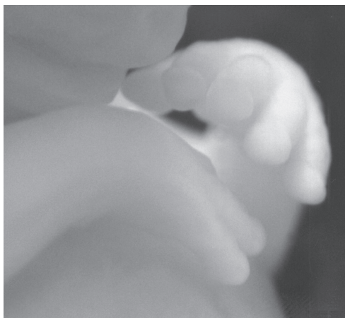
Rączki dziecka ok. 7 tygodni od poczęcia.

Do Kancelarii Sejmu do 16 kwietnia 2007 r. wpłynęło 508 683 podpisów pod apelem o wprowadzenie do Konstytucji RP zapisu gwarantującego ochronę życia człowieka od momentu poczęcia do naturalnej śmierci. 1987 osób nadesłało sprzeciw wobec takiego projektu nowelizacji Konstytucji.