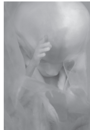
Dziecko ok. 3,5 m-ca od poczęcia.