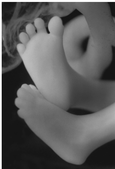
Nóżki dziecka ok. 11 tygodni od poczęcia.

oprac. dr n. med. Józefa Deszczowa