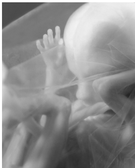
Dziecko ok. 3,5 miesiąca od poczęcia.