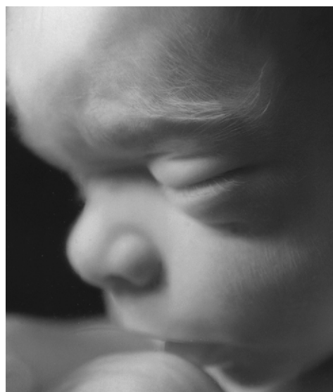
Twarz dziecka ok. 5 miesięcy od poczęcia.